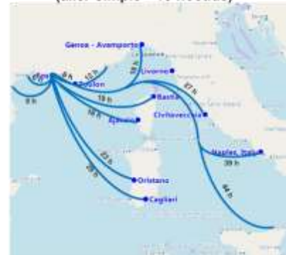
Durée de voyage à partir de Fos pour différents ports méditerranéens (aller simple - 13 noeuds)

Fos Tonkin est idéalement placé pour alimenter en GNL un grand nombre de ports de Méditerranée occidentale.