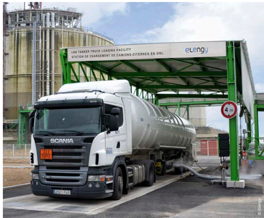
Opération de chargement d'un camion-citerne au terminal méthanier de Montoir-de-Bretagne