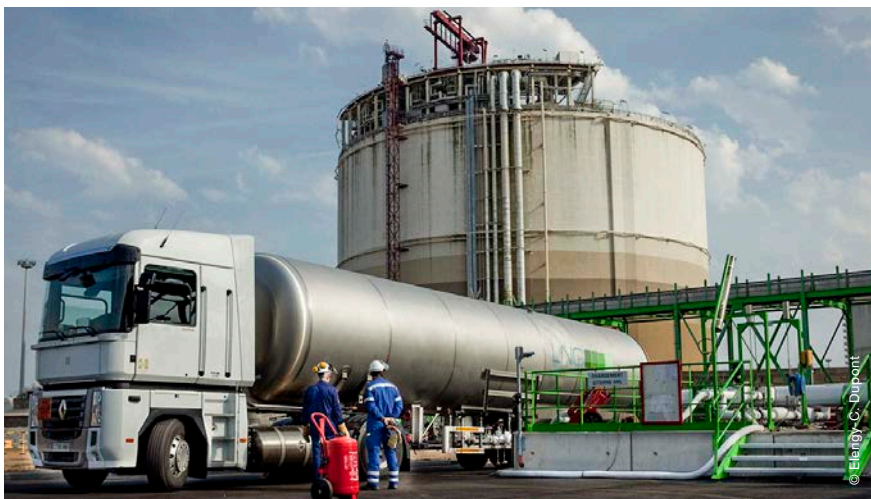
Poste de chargement de camions-citernes

Ils offrent également la possibilité de développer des connexions GNL par chemin de fer ou voies fluviales et côtières.